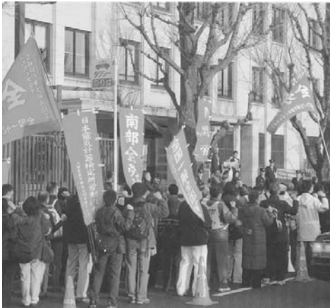
3・23 けんり春闘中央決起集会

憲に向かつては、それだけが自分の使命のよき上、しゃにむに突き進む阿部内閣。こんな危険な内閣をこれ以上放置しておくことは出来ない。国民投票法成立を阻止し、統一地方選挙、参議院選挙で護憲派の勢力を拡大し、安倍政権打倒を目指し闘おう。