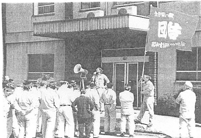
▲3・22昭和電気鑄鋼労組ストライキ(群馬) 3千円という超低額回答が出され、抗議の半日ストに起つ!! スト集会には多くの支援があり、今後も2波、3波と闘い抜く決意

▼大阪では、ストライキとともに、阪神高速公団などへの抗議総行動が取り組まれた。茨木消費者クラブへの抗議行動中、教育合同増田委員長が刃物で刺され重傷を負った。“抗議の集中”を!!