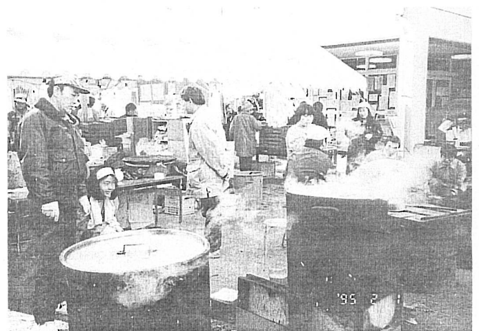
▲ 炊出し、御影小学校で（大阪全労協）