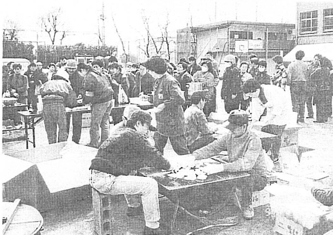
▲ 2月9日 長田区大橋中学校でもちつき、焼きもち（自立労運）