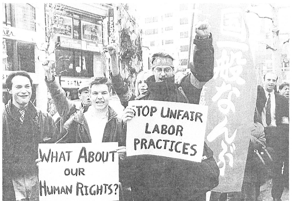
▲ NOVA関東本拠校（東京・原宿）前抗議行動

今年で3年目を数える外国人労働者の春闘統一行動が、3月26日国労会館での集会、翌27日争議支援という日程で闘われた。集会には、外国人労働者約200名が参加。争議支援は、清水建設（下請の労災かくし、労災保険ネコババ／神奈川シティユニオン）、NOVA外語学院（不当労働行為、解雇、ドラッグテスト強要など／全国一般なんぶ）、日本ファイリング（労災・解雇／FLU）での社前抗議を行なった。